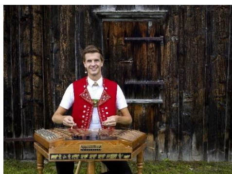
Nicolas Senn © Nicolas Senn