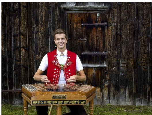
Nicolas Senn © Nicolas Senn